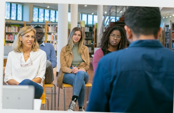
Félicitations pour l'obtention du concours !

Lors de nos permanences à l'INSPÉ, mais également par mail, nous vous fournirons, au fur et à mesure des mois, des informations concrètes (reclassement, obligation réglementaire de service, action sociale...).